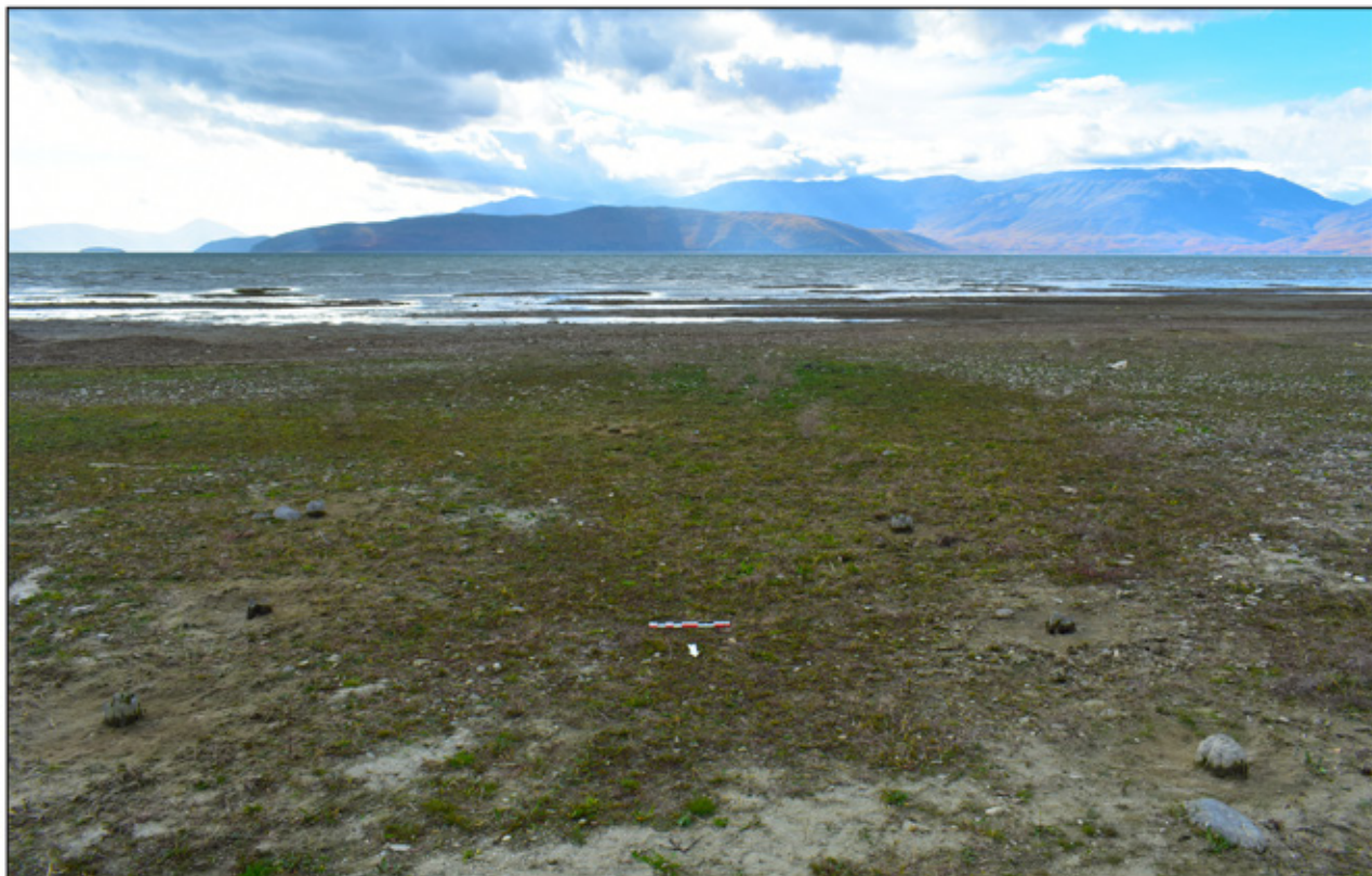
Сл. 3. Археолошки локалитет Прекоп кај Асамати, поглед од север.