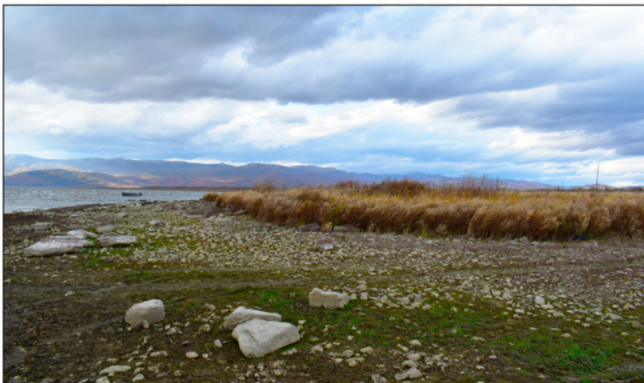
Сл. 7. Концентрација на камења во полукружен облик источно од локалитетот Прекоп.