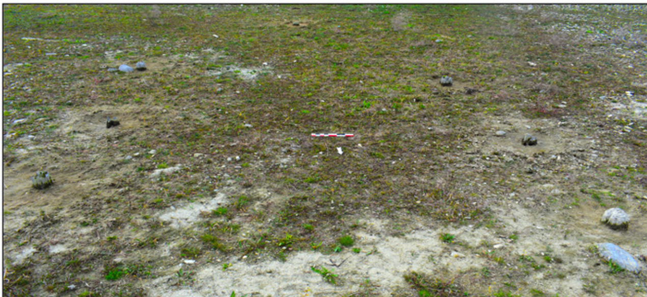
Сл. 4. Остатоци од дрвена структура на локалитетот Прекоп (Фото: Гоце Наумов).