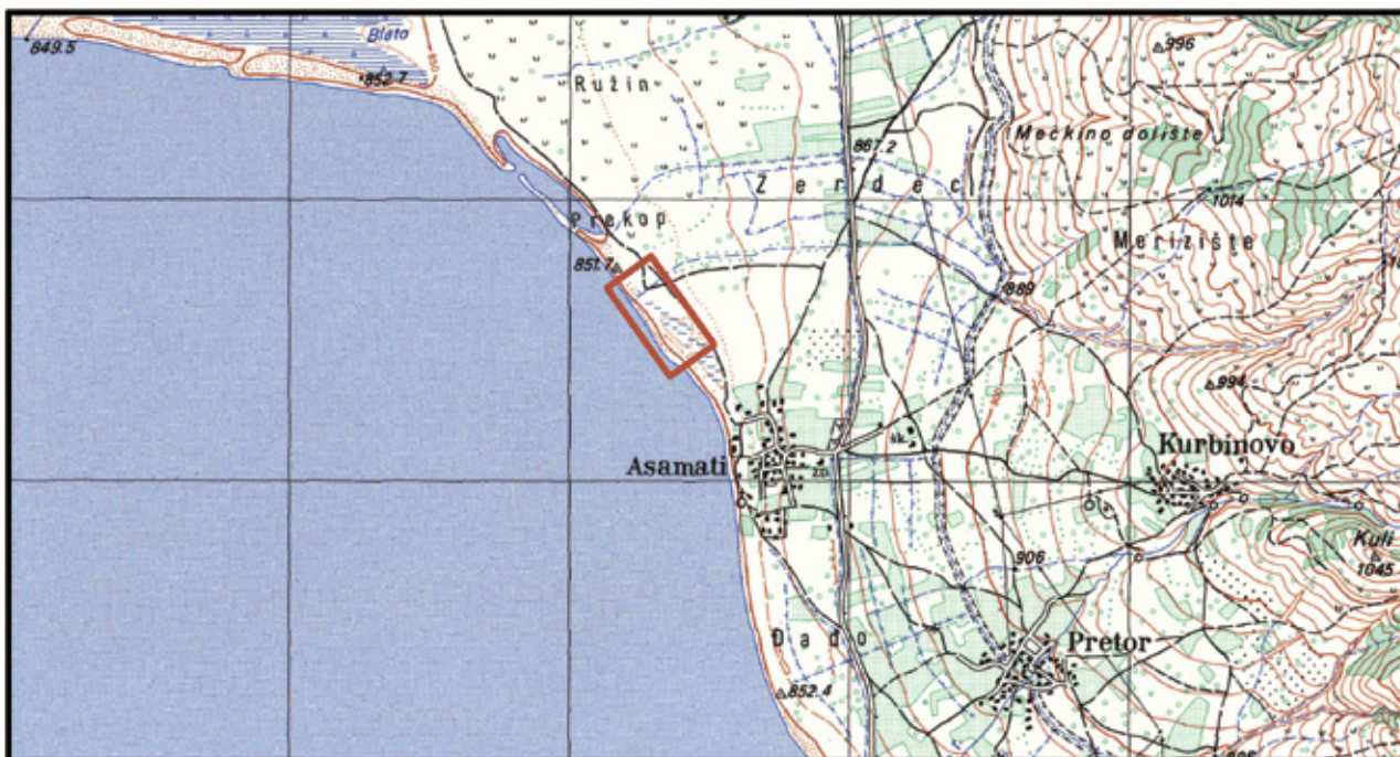
Сл. 2. Топографска карта на Асамати и околината со посочена позиција на археолошкиот локалитет Прекоп.