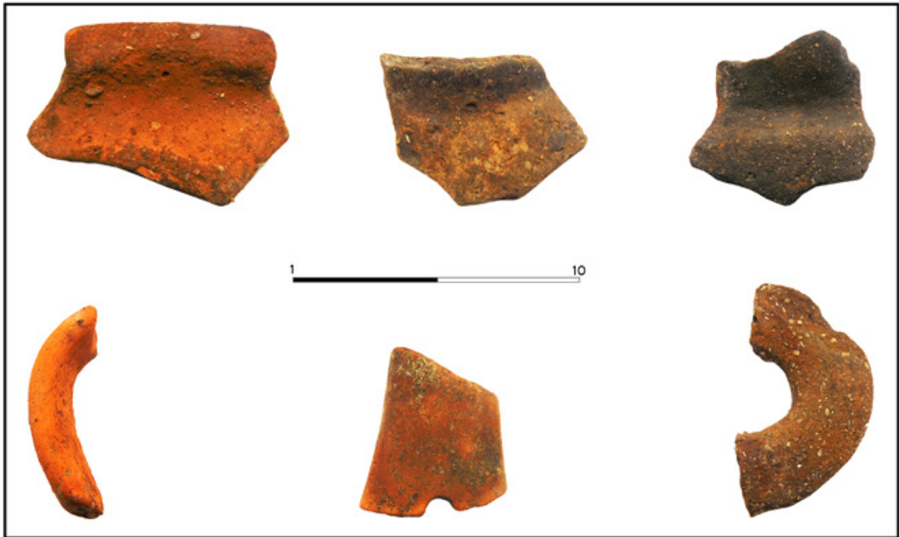
Сл. 8. Керамички фрагменти откриени во концентрацијата на камења источно од локалитетот Прекоп (Фото: Јасмина Гулевска; обработка: Гоце Наумов).