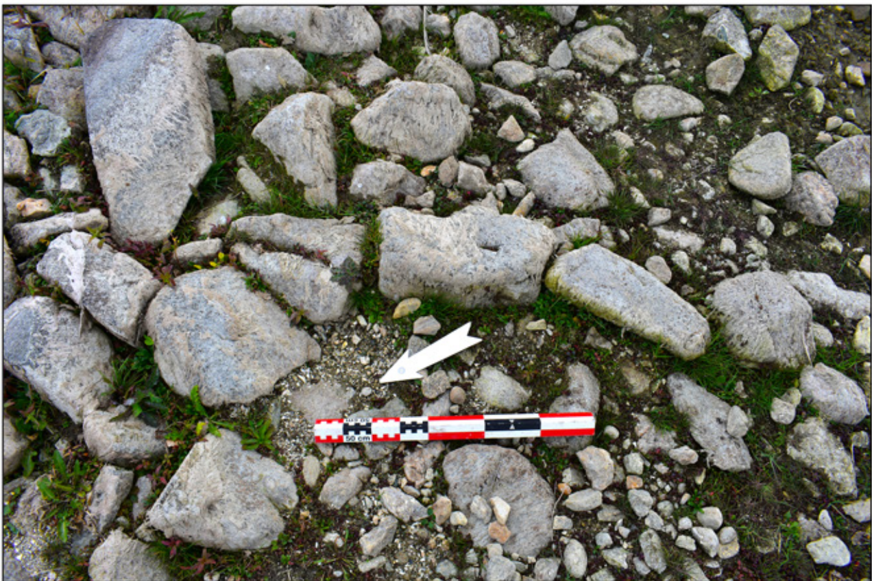
Сл. 9. Ситуација во концентрацијата на камења источно од локалитетот Прекоп (Фото: Гоце Наумов).