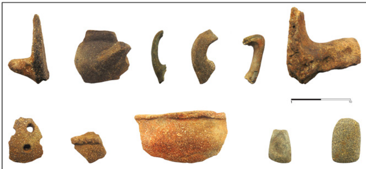
Сл. 6. Наоди од бронзеното време откриени на површината на локалитетот Прекоп (Фото: Јасмина Гулевска; обработка: Гоце Наумов).